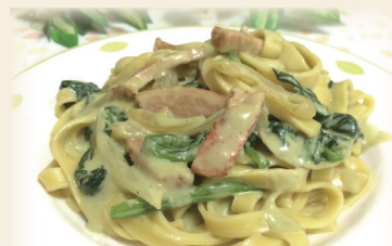
パスタなどのお料理に

桑の葉に含まれる成分を美味しく摂取するために、パウダー状に加工し、様々な食品に活用できるようにしました。のど越しの良い粉末にするため『石臼仕立て製法』を採用。抹茶のような細かさで、まろやかなコクがあります。