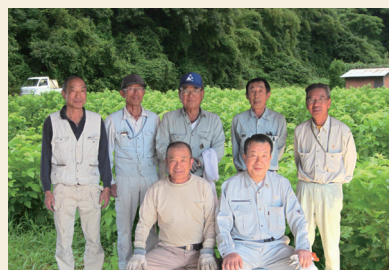
農事組合法人 南アルプスシルクファーム ＜山梨県＞