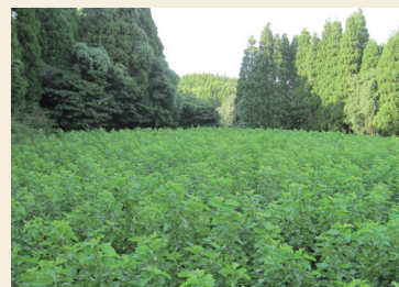
合同会社オーガニック・アグリシア ＜熊本県＞

原料の桑の葉は、東京農業大学農学部の栽培指導の下、契約農家が養分の多い品種を苗から育てて収穫をしている貴重な桑の葉です。害虫は桑の葉を食べてもエネルギーにならない事を知っている為、農薬を使わずに育てられます。